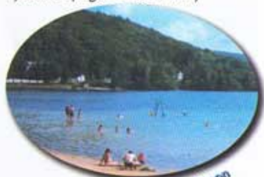
Plage du Lac Simon