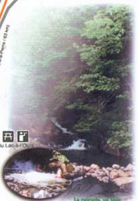
La cascade, un beau tourbillon naturel